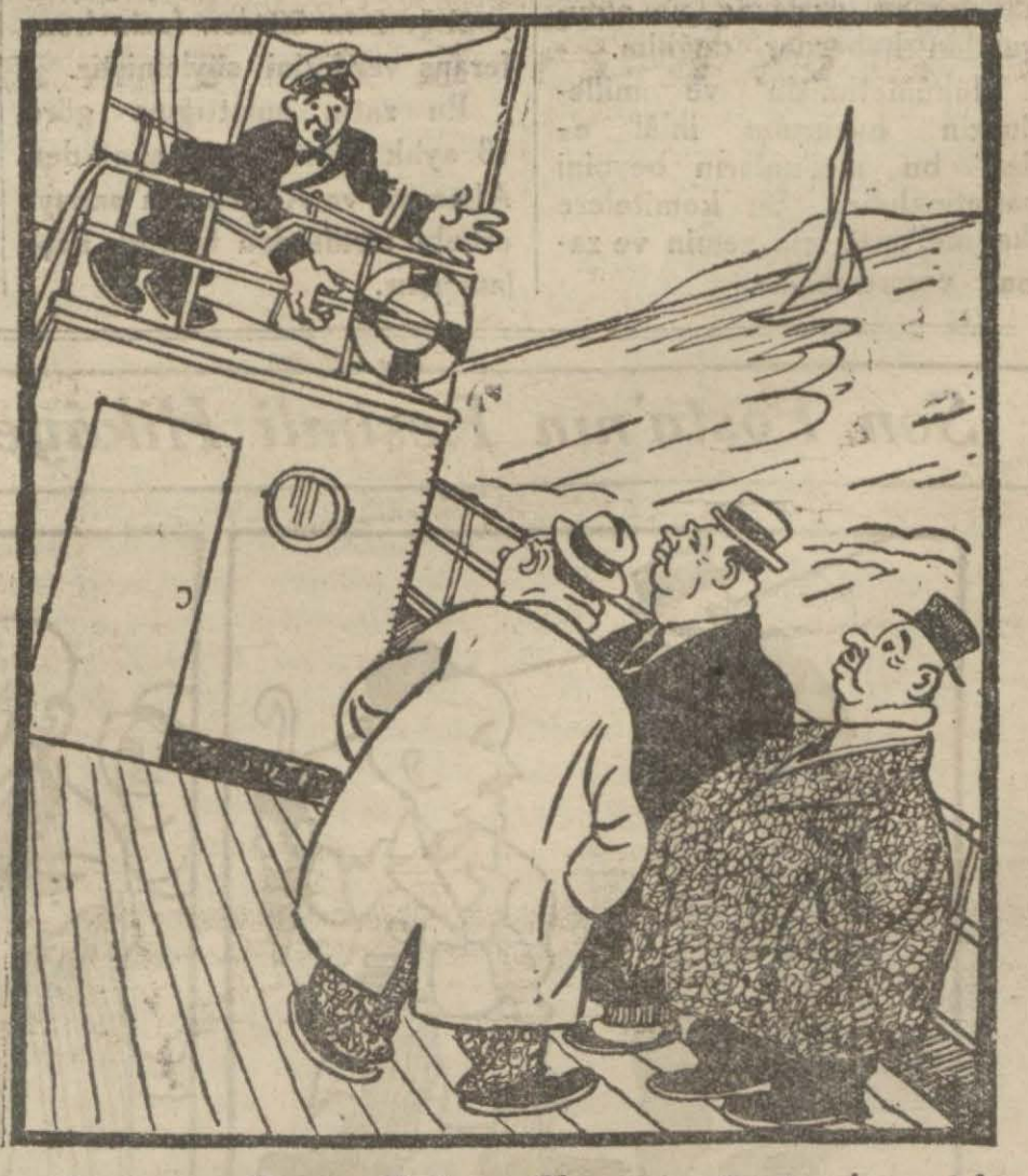
Kaptan — Şişman Beyler... Kuzum, güverte kenarında konuşmayın, batacağız