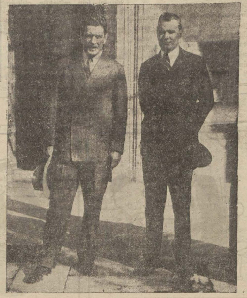
Tuney, boksu dövülmeaen bırakan ilk şampiyonudur

Tuney, Hayatının Yarısını Mülâkatla Geçirmiştir.. Sabah saat dokuz buçuk. Beyoğlundaki İstanbul Palas'ın önü meraklılarla dolu, şampiyonun çıkmasını bekliyorlar. Otelden içeri girdim. Sabık cihan boks şampiyonu Tuney karısıyla merdivenleri iniyor. Meşhur zamana ait fotoğraflarından tanıdığım şampiyona yaklaşıyorum. Benim gazeteci olduğumu farkedenden cihan şampiyonu: — "Spor hayatımı kapadım artık," cümlesile beni atlatıyor. Kendisile spordan başka şeylerden konuşacağımı söyleyerek otelin methalinde alıkoymaya muvaffak oluyordum. Bu muvaffakiyetime dışarda bekleyen kalabalığın da çok yardımcı oluyor. Biriken ahaliyi gazeteci zanneden Tuney ve karısı çıkmak istemiyorlar. Tuney Nasıl Bir İnsandır? Yüzüne dikkatle bakıyorum. Yüzü mütecevaz yaptığı müthiş dövüşlerden en küçük bir işaret yok! Hiç boks yapmamış bir adam gibi, yüzü bütün zeki hututu ile uzunca... (Devamı 6 inci sayfadadır)